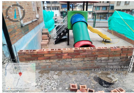
Armado de mamposteria nueva sobre existente para dar nivel