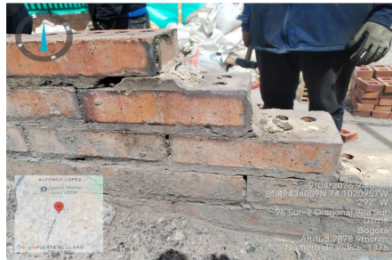
Demolicion de muro existente por fallo en mortero de pega