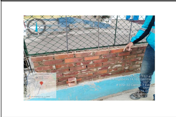
Armado de muro en mamposteria, se hace observacion terminacion de muro