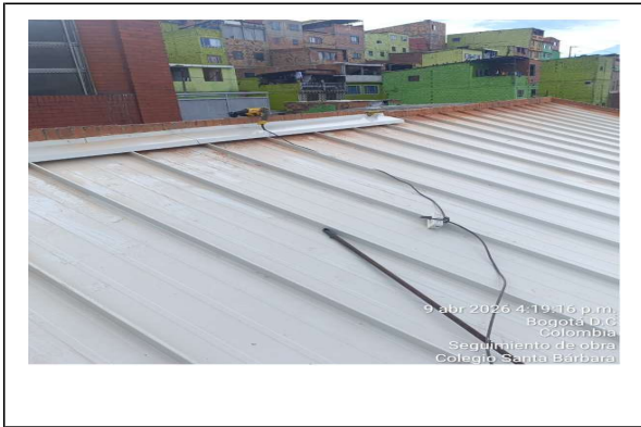
instalacion flanches en cubierta