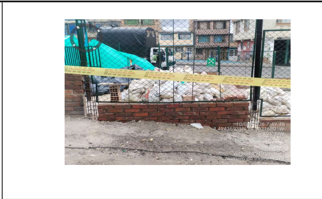
inicio de armado de muro con dovelas