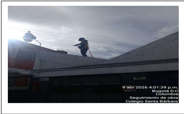
Instalacion flanches en cubierta