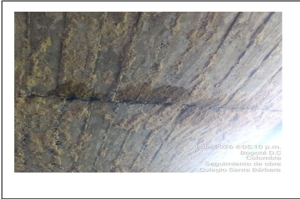
Filtracion de agua por las grietas existentes.