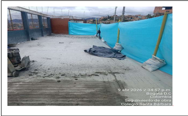
instalacion de cerramieno para delimitacion de area de trabajo