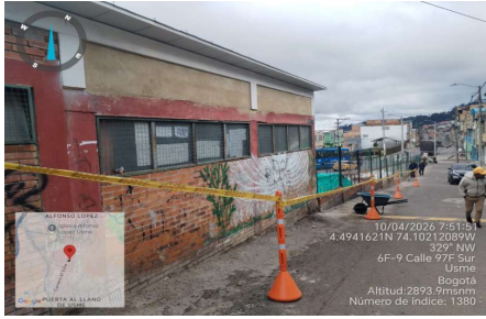
Señalización y delimitación de áreas