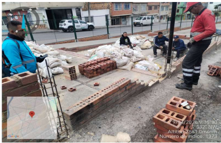
Demolicion de mamposteria por falla en trabas de unidades